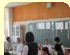
【お互いの意見を比べる】