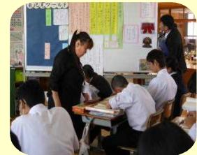
【根拠を明確にして書く】