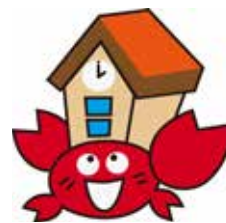
本校オリジナルキャラクター 「とんがりやどかりちゃん」