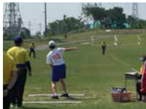
【フライングディスク部】