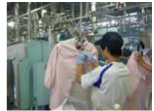
【デュアル型実習の様子】