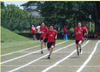
＜スポーツフェスティバル＞