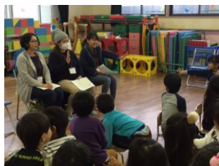
お母さんたちも群読!?