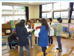
保護者の方々の作戦会議