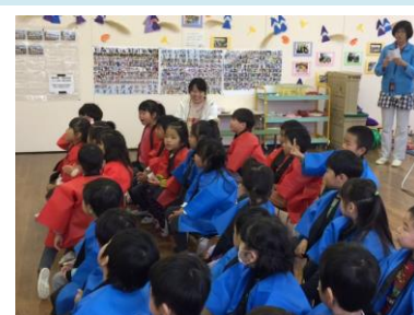
お母さんたちも上手!!