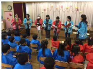
お母さんたちも参加!