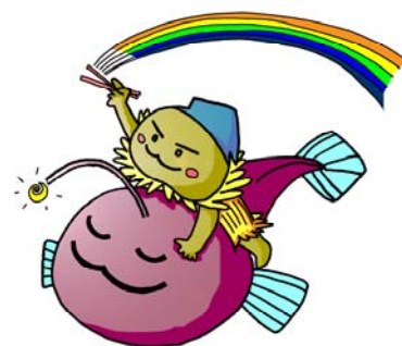
「アンピカンとなっくん」